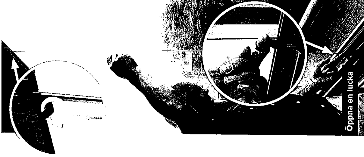
Öppna en lucka